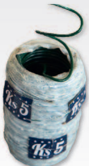
FIL SIMPLE VERT