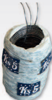
FIL TRIPLE RÉSISTANCE